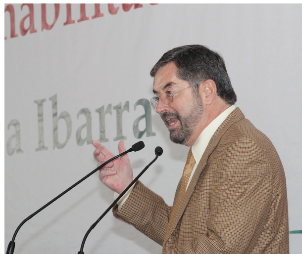
Dr. Juan Ramón de la Fuente.

Los Institutos Nacionales de Salud, son proyectos nacionales de salud; en los que hay enfrentar y superar las adversidades. Se requiere liderazgo, pasión, inteligencia, por supuesto, trabajo en equipo, cariño, conducción, fortaleza y coraje.